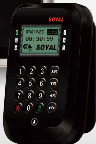
液晶顯示門禁控制器 AR-837-E