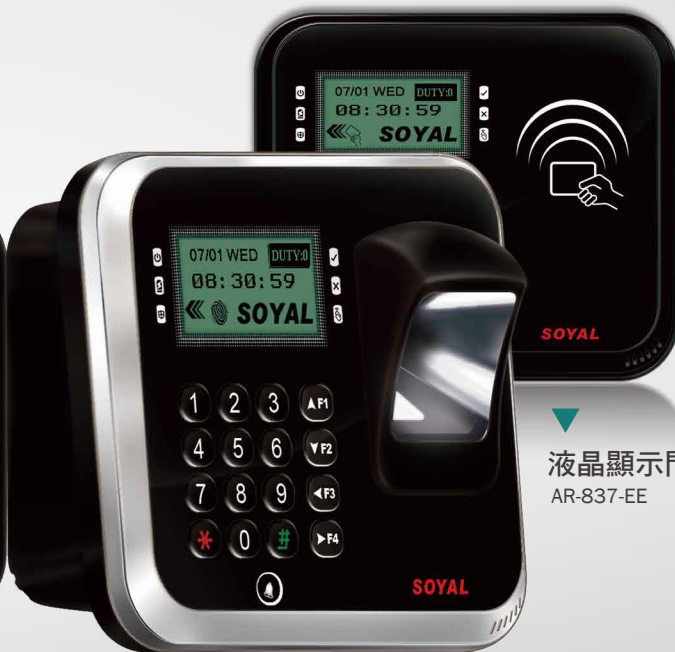
液晶顯示門禁控制器 AR-837-EE